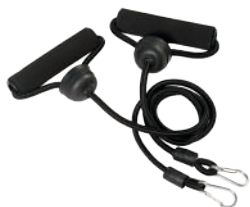
Эластичные эспандеры (2 шт)