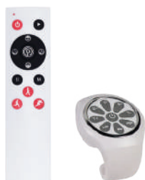
Пульт ДУ и bluetooth браслет (поставляются без батареек)